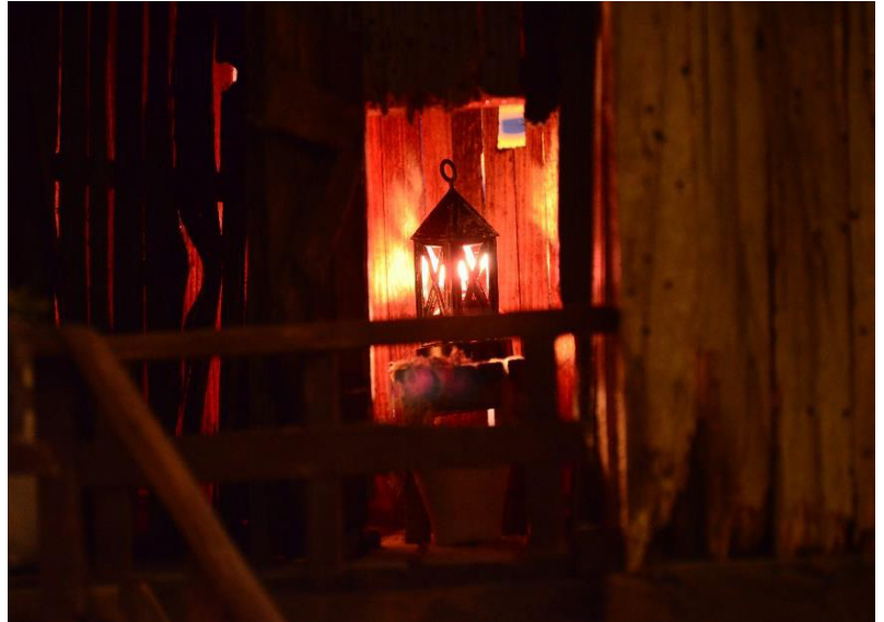
Titel des Bildes „nach Hause kommen“

Als aber die von Gott festgesetzte Zeit kam, sandte er seinen Sohn zu uns. Christus wurde wie wir als Mensch geboren. Er sollte uns befreien, die wir Gefangene des Gesetzes waren, damit wir zu Kindern Gottes werden. Weil ihr nun seine Kinder seid, schenkte euch Gott seinen Geist, denselben Geist, den auch der Sohn hat. Jetzt können wir zu Gott kommen und zu ihm sagen: »Abba, Vater!« Ihr seid also nicht länger Gefangene des Gesetzes, sondern Söhne und Töchter Gottes. Und als Kinder Gottes seid ihr auch seine Erben, euch gehört alles, was Gott versprochen hat.